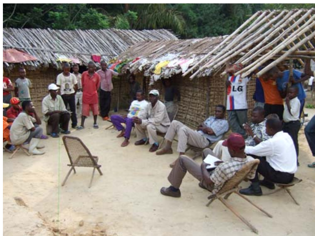
Participación plena y efectiva: un requisito para REDD+

La participación de la sociedad civil en el MI-REDD y su inclusión en el sistema más amplio de monitoreo de REDD+ va a ser crucial para mejorar el diálogo y la confianza entre las partes interesadas, a menudo polarizadas.