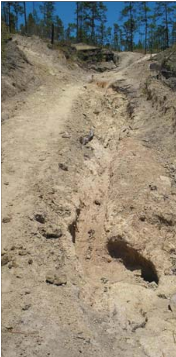
Fotos 2 y 3. Zanjas causadas por la escorrentía del agua en los caminos.

que en uno de los dos casos a pocos metros del nacimiento mismo se estableció una bacadilla (Foto 2). Todo ello no sólo infringe las leyes, sino que contribuye directamente a alimentar las tensiones sociales y, en particular, el sentimiento de rechazo que de forma creciente las poblaciones locales sienten contra cualquier operación forestal.