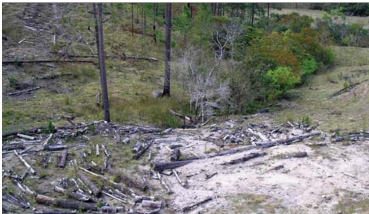
Foto 1. Restos de una bacadilla localizada a pocos metros de un nacimiento de agua (informe no. 12).

El monitor ha podido observar de primera mano algunas de las prácticas ilegales que afectan a dicho recurso. Las misiones documentadas en los informes no. 11 y 12 exponen casos patentes de incumplimiento del Art. 64 de la Ley Forestal (Decreto No. 85-71), que prohíbe la explotación de árboles dentro de 250 metros de cualquier nacimiento de agua y en una faja de 150 metros a los dos lados de cualquier curso de agua permanente. El informe 12, además, evidencia la discrecionalidad con la cual los técnicos evalúan los nacimientos y cursos de agua al momento de preparar los planes operativos para el aprovechamiento de madera. Documenta la presencia de por lo menos dos nacimientos de agua que no fueron tomados en cuenta en la preparación del plan operativo supervisado. Alrededor de estos nacimientos se hubiera tenido que delimitar una zona de protección de 250 metros. Sin embargo, no sólo se realizaron actividades de aprovechamiento a menor distancia de ambos, sino