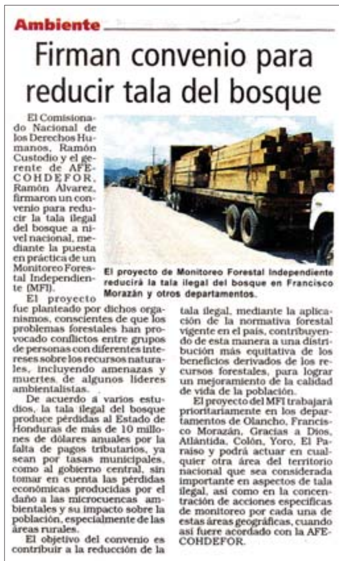
Figura 1. Artículo publicado por el periódico La Tribuna sobre la firma del convenio de MFI entre el CONADEH y la AFE-COHDEFOR.

Los objetivos 3 y 4 también han sido cumplidos, en particular a través de la implementación de misiones de campo conjuntas con la AFE-COHDEFOR. En muchos casos se han podido compartir experiencias e identificar factores limitantes, especialmente la falta de recursos materiales con los que los empleados de la institución se ven obligados a llevar a cabo su trabajo. En otros casos se ha podido evidenciar la persistencia de malas prácticas, tanto en aspectos técnicos como administrativos. A grandes rasgos, sin embargo, la colaboración con la AFE-COHDEFOR ha resultado positiva, aunque el seguimiento a los hallazgos de los informes ha sido lento. La sección 5 de este informe proporciona más detalles sobre esto.