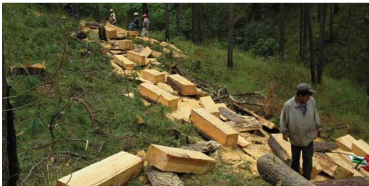
Foto 4. Madera cortada con motosierra por aserraderos locales.

La evidencia anecdótica e investigaciones hechas por varios observadores sugieren que este tipo de fraudes son frecuentes tanto en el sector forestal de Honduras como en el de muchos otros países, y representan un punto de interés y desafío clave para las autoridades, así como para el MFI.